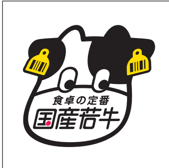
比率変更・変形の禁止