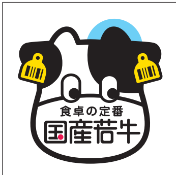
他の要素付加の禁止