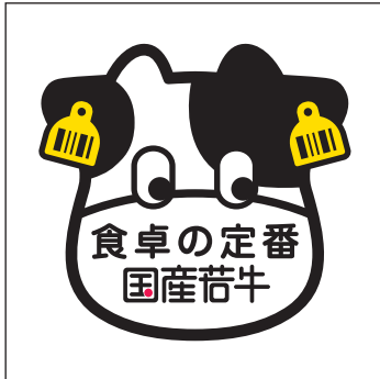
文字バランス変更の禁止